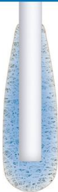
В обычном тампоне волокна беспорядочно спутаны в "подушку"