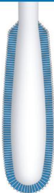
Новый велюр-тампон имеет ровные короткие ворсинки

В обычных ватных (или вязкозных) тампонах "подушка" из спутанных волокон, соприкасаясь с собираемым материалом, пропитывается им и задерживает в себе часть образца. Полной противоположностью является велюр-тампон, в котором собираемый материал находится между короткими ровными ворсинками и быстро полностью высвобождается в среду, не задерживаясь на тампоне.